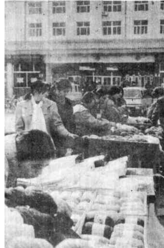
市百纺站面对市场竞争激烈的状况，转变服务观念，完善服务功能，采取开仓零售、批零兼营等一系列营销策略，既方便了客户，又取得了可观的效益，日销售额均在10万元以上。