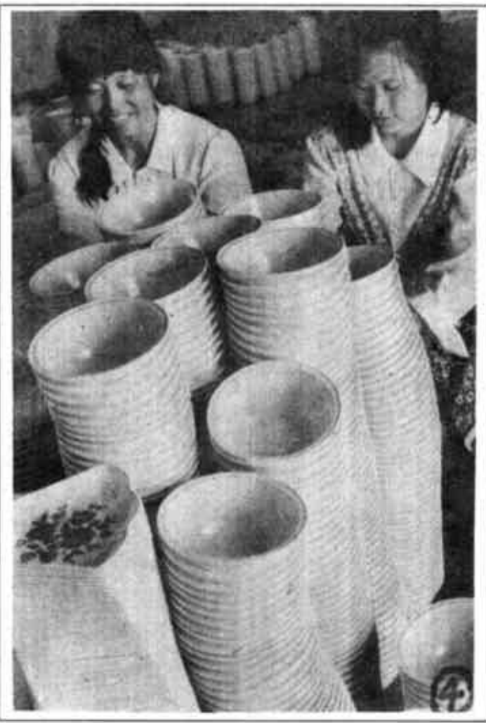
陈官乡水泥制品厂坚持以质量促效益的生产方针，产品以其质优价廉赢得用户的好评。陈官乡根据市场需求，投资100余万元办起一家高级仿瓷餐具厂。目前，该产品已在东营、内蒙、北京等地打开销路。

陈官乡面粉厂通过租赁承包，更加焕发了生机，年创利税由过去的2万元增加到20万元。陈官乡卫生院开设了市首家精神科。该科采用中西医结合治疗，以其疗程短、见效快、收费低等特点受到好评。