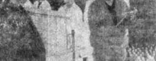
12月14日下午，津滨宾馆二号楼会议室里，津滨县的市、县两级人大代表50多人，在对全县的部分企业、乡镇、村进行了两天视察后，正在这里集中座谈、讨论、分析。大家热烈发言，各抒己见，争相为津滨县经济振兴献计献策。